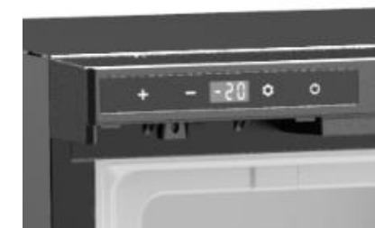
INDICADOR DE TEMPERATURA