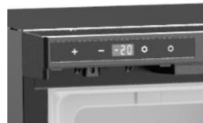
INDICADOR DE TEMPERATURA